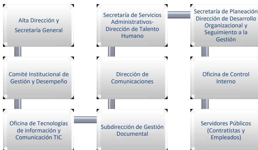
Ilustración 1 Roles y Responsabilidades-Elaboración propia

EL líder de la Política de Gestión Documental es la Secretaria General a través de la Subdirección de Gestión Documental, quien formula y coordina la Política y quienes para sus efectos se apoyan en los miembros del Comité del Sistema Integrado de Gestión de la Alcaldía Municipal de Sabaneta, y en los miembros del Comité Institucional de Gestión y Desempeño - MIPG, quienes velarán y acompañarán el cumplimiento en la ejecución de la presente política; en el desarrollo de sus actividades se comprometen a incorporar y mantener actualizado dentro de sus programas la capacitación en gestión documental y sus continuas actualizaciones dando la importancia que le asiste a fin de continuar con los procesos de mejora continua.