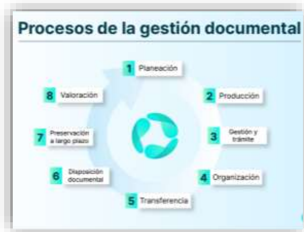
Imagen. Procesos de Gestión Documental

La Gestión documental se fundamenta en ocho (8) procesos que deben desarrollarse en todos los niveles en la Alcaldía de Sabaneta, como lo define el Decreto 1080 de 2015, en su artículo 2.8.2.5.9, y el Acuerdo 001 de 2024, estos procesos son los siguientes: