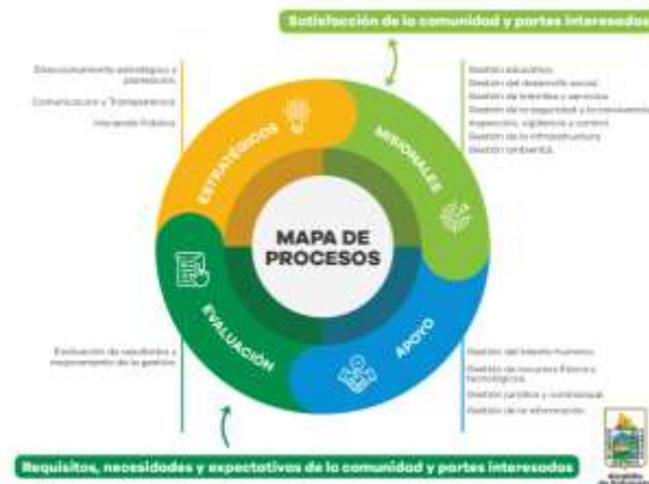
Imagen. Procesos de Gestión Documental SIGSA

La Alcaldía de Sabaneta, presenta el Programa de Gestión Documental – PGD, conforme a al marco normativo, técnico y a los lineamientos establecidos en la Política de Gestión Documental de la Entidad, que reconoce los documentos como fuentes fiables de información, que garantizan la seguridad y la transparencia de las actuaciones administrativas