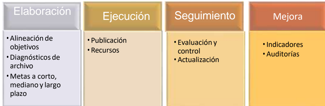
Ilustración 2. Fases de Implementación del PGD

El proceso de implementación el PGD, se establecerá de acuerdo con lo normado en el Decreto 1080 de 2015, se determina en cuatro grandes fases: la elaboración, ejecución, seguimiento y mejora del mismo.